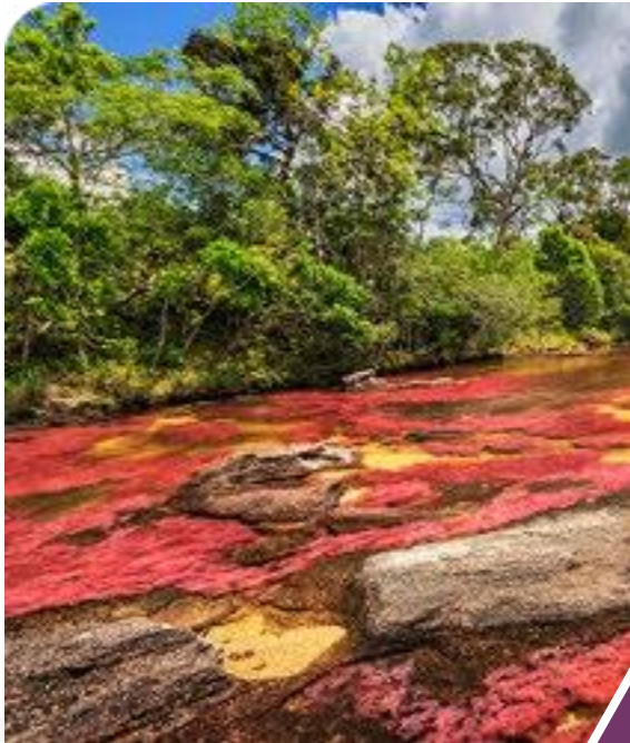
Caño Cristales, La Macarena. Meta, Colombia.

Denuncia ante las instituciones encargadas los actos que se conozcan de explotación de flora y fauna