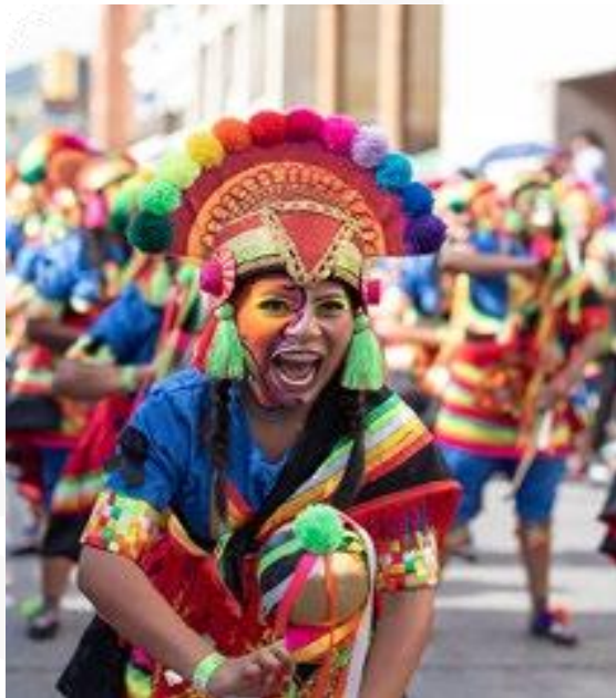
Carnaval de Negros y Blancos de Pasto

El patrimonio mueble son todos los productos y bienes materiales que se pueden mover como monumentos y esculturas que son expresión la nacionalidad de un país, en nuestro caso nacionalidad colombiana.