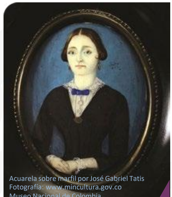
Acuarela sobre marfil por José Gabriel Tatis Fotografía: www.mincultura.gov.co Museo Nacional de Colombia