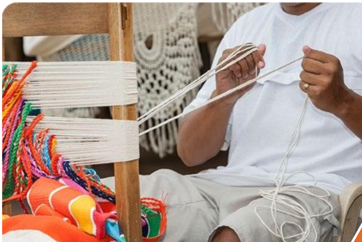
Arte de Colombia hecho a mano.

Cumple con las políticas establecidas para la compra de productos autóctonos de cada región.