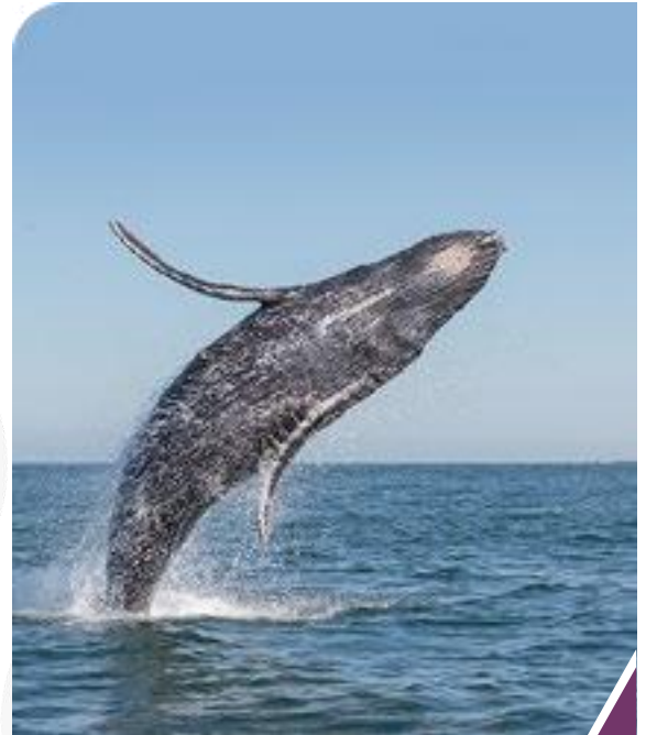
Ballenas jorobada o yubarta. Pacífico colombiano.