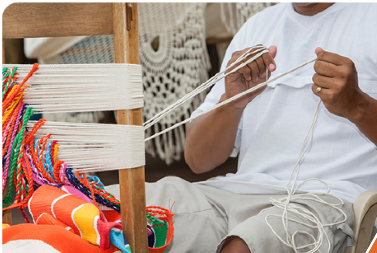
Arte de Colombia hecho a mano.

Cumple con las políticas establecidas para la compra de productos autóctonos de cada región.