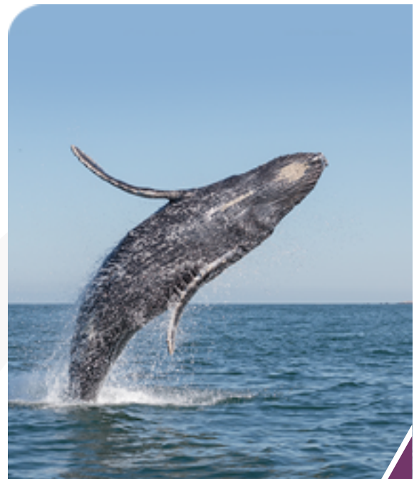
Ballenas jorobada o yubarta. Pacífico colombiano.