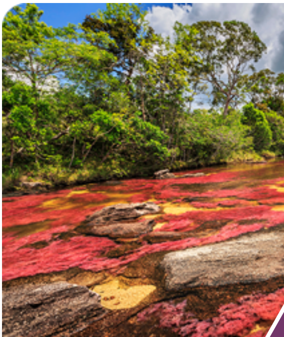
Caño Cristales, La Macarena. Meta, Colombia.

Denuncia ante las instituciones encargadas los actos que se conozcan de explotación de flora y fauna.