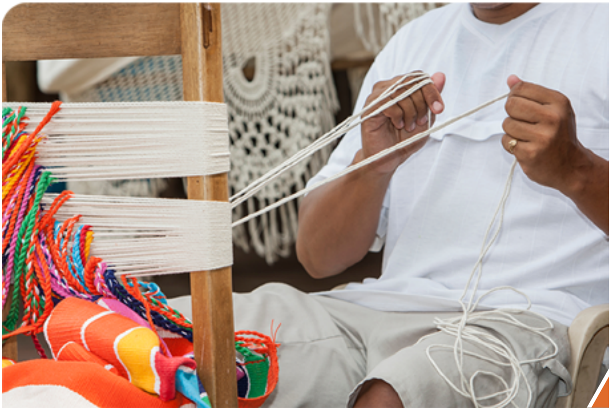
Arte de Colombia hecho a mano.

Cumple con las políticas establecidas para la compra de productos autóctonos de cada región.