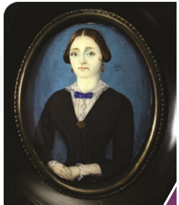
Acuarela sobre marfil por Jose Gabriel Tatis Fotografía: www.mincultura.gov.co Museo Nacional de Colombia