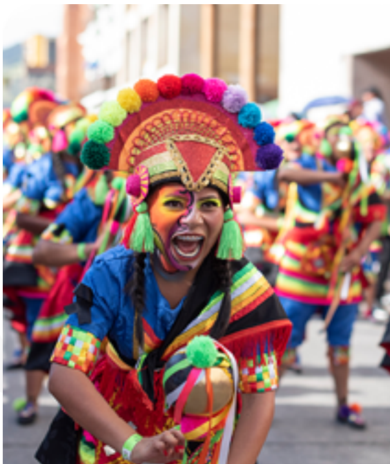
Carnaval de Negros y Blancos de Pasto

El patrimonio mueble son todos los productos y bienes materiales que se pueden mover como monumentos y esculturas que son expresión la nacionalidad de un país, en nuestro caso nacionalidad colombiana